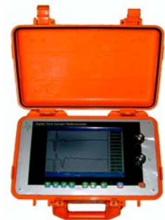
测距主机 波形记录分析仪