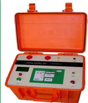
中央控制 弧反射滤波及保护